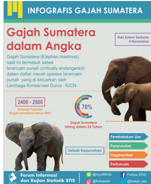
Gambar 3. Infografis Populasi Gajah Sumatera

Indonesia. Untuk mewujudkan visi tersebut mereka secara rutin melakukan aksi tuntutan kepada pihak-pihak terkait untuk menghentikan aksi-aksi perdagangan satwa yang terjadi di Indonesia.