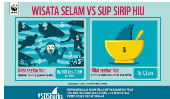
Gambar 2. Perbandingan Nilai Hiu.

Kendati demikian, persoalan utamanya adalah ikan tersebut diburu untuk siripnya dikonsumsi, bukan terletak pada penangkaran atau penjualan ilegal. Bahkan, WWF cenderung mendukung hiu untuk dijadikan objek wisata menyelam dengan pendekatan ekonomis. Berikut gambar yang dicantumkan dalam situs resmi: