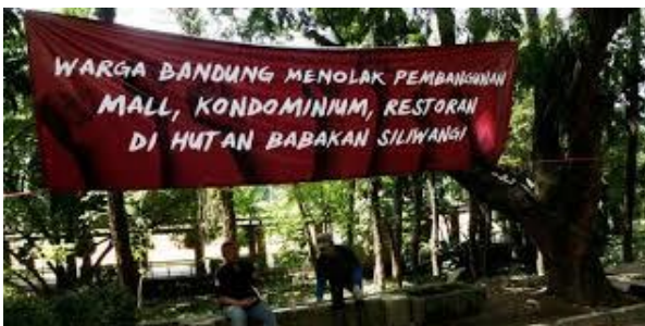
Gambar 4. Spanduk Penolakan Warga

Sedangkan pembuat petisi ini adalah Forum Warga Peduli Babakan Siliwangi (FWPBS). Mereka dikenal sebagai forum militan yang berisikan aktivis lingkungan, budayawan, dan seniman di Bandung. Forum ini melakukan gerakan dengan menggalang dukungan melalui petisi online maupun aksi turun ke lapangan langsung. Dilaporkan dalam Tempo.co, FWPBS (20/5/2013) melakukan aksi pencopotan pembatas area komersialisasi dan dilanjutkan dengan longmarch sepanjang 3 kilometer ke Kantor Pemerintah Kota Bandung.