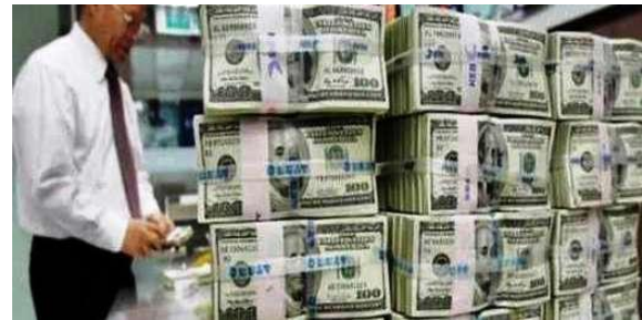
Gambar 1. Elemen Grafik berupa foto pada artikel 1

yang sedang dibangun oleh VOA-Islam untuk kembali mengangkat wacana historis tentang kerusuhan '98 ini.