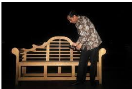
Gambar 3 Elemen Grafik berupa foto pada artikel 3

Elemen retorik yang mencolok terlihat ialah elemen gambar berupa foto yang ditambahkan. Walaupun foto ini didominasi dengan warna hitam gelap, foto ini tetap mencolok dengan sosok yang ada di dalamnya. Sosok tersebut adalah Joko Widodo, Presiden Republik Indonesia. Yang membuat sosok tersebut mencolok adalah posenya. Pose berdiri tidak sempurna, cenderung membungkuk dengan kedua tangan di depan perut memegang mikrophone. Dengan adanya kursi panjang yang ada di belakang Jokowi, sebenarnya bisa dimengerti bahwa pose yang tidak sempurna itu karena diambil ketika Jokowi hendak duduk dikursi tersebut.