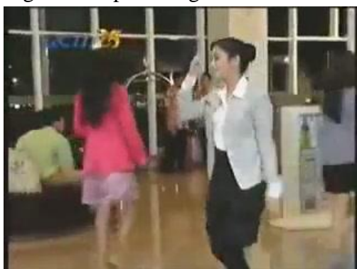
Gambar 1. Model pakaian formal Mawar

patriarkhi yang menempatkan perempuan pada sektor domestik. Dengan kata lain, perempuan menjadi terpinggirkan karena perannya lebih pada kegiatan di lingkup rumah tangga. Sinetron KNY menampilkan tokoh Mawar sebagai pegawai pada sebuah hotel sehingga ini menjadi sesuatu yang berlawanan dengan konsep patriarkhi, dan inilah yang menjadi salah satu ajaran feminisme liberal yang menentang penempatan perempuan sebagai kelompok marginal.