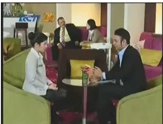
Gambar 4. Mawar saat menemui tamu