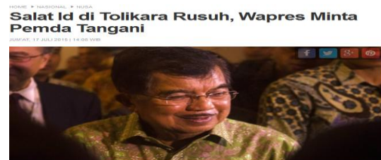
Gambar 2 Berita tentang konflik Tolikara di Tempo.co

Upaya perdamaian ini dapat dilihat pada beberapa berita yang diposting baik pada tanggal 17 maupun 18 Juli 2015, dimana judulnya sudah mengarah ke arah penanganan kasus. Misalnya “Salat Id di Tolikara Rusuh, Wapres Minta Pemda Tangani”. Pada awal berita ini langsung mengutip pernyataan Wakil Presiden Jusuf Kalla yang menyesalkan terjadinya bentrokan antar warga di Kabupaten Tolikara. Wapres juga menghimbau aparat polisi dan pemerintah daerah Papua segera menyelesaikan kasus ini dengan baik.