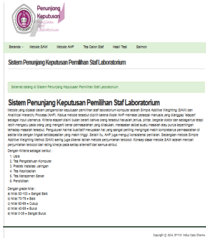
Gambar 5. Antarmuka Aplikasi

Gambar 5 merupakan tampilan halaman utama aplikasi yang terdiri dari 5 (lima) menu yaitu menu beranda, menu metode SAW, menu metode AHP, menu tes calon staf dan menu hasil tes.