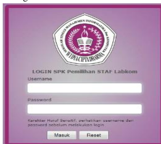
Gambar 4. Login User

dengan menggunakan Simple Additive Weighting (SAW) dan Analytical Hierarchy Process (AHP) akan berfungsi sebagai sarana untuk mempercepat pengambilan keputusan di lingkungan manajemen STMIK Widya Cipta Dharma Samarinda. Pengembangan sebuah perangkat lunak untuk sistem pendukung keputusan pemilihan staf laboratorium komputer di STMIK Widya Cipta Dharma Samarinda dengan Metode Simple Additive Weighting (SAW) dan Analytical Hierarchy Process (AHP) mencakup penentuan spesifikasi sistem yang dibutuhkan oleh aplikasi, perancangan antarmuka pengguna. Berikut dapat dilihat tampilan login dan antarmuka pada gambar 4 dan gambar 5.