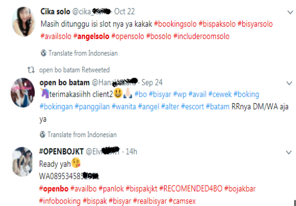
Gambar 5. Komunikasi Level Makro di Twitter

Pelaku prostitusi daring di Twitter juga memanfaatkan fitur hashtag ini untuk mempromosikan jasanya. Ada beberapa kata kunci yang sering dipakai antara lain #avail (dari kata available bahwa mereka dapat di- booking ) #realava (merujuk pada real avatar atau foto asli) #bisyar (singkatan dari ‘bisa bayar’), #bispak (singkatan dari ‘bisa pakai’), #openBO (singkatan dari ‘ open booking order ’). Untuk mempersempit lokasi maka biasanya tagar tersebut diikuti dengan nama kota di mana pelaku prostitusi daring berada. Misalnya #angelsolo #bojakbar #bisyarbandung dan lain sebagainya.