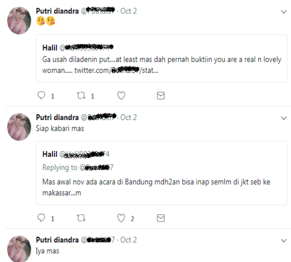
Gambar 4. Komunikasi Level Mikro di Twitter.

layanan prostitusi dan pelanggan pun juga tidak akan menggunakan akun asli dalam melakukan komunikasi. Tidak ada kedekatan personal antara pelaku dan pelanggan prostitusi sebagaimana komunikasi mikro lainnya di Twitter. Komunikasi lebih personal seperti kesepakatan dalam melakukan transaksi menggunakan platform lain karena lebih private . Platform paling banyak digunakan adalah Whatsapp karena fungsinya yang lengkap dan mudah dalam menggunakannya.