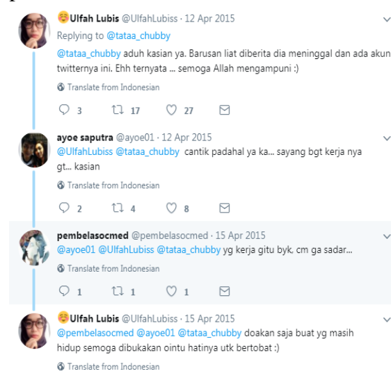
Gambar 1. Ucapan Duka Cita Atas Meninggalnya Deudeuh Alfi Syahrin

polisi di lokasi tempat transaksi seks maka forum dianggap sudah tidak aman karena banyak polisi yang menjadi anggota forum sehingga para pelaku kemudian pindah platform ke Twitter seiring dengan mulai maraknya Twitter digunakan sebagai media sosial. Salah satu kasus prostitusi daring via Twitter yang menghebohkan adalah terbunuhnya Deudeuh Alfi Syahrin (akun Twitter @tataa_chubby) oleh pelanggannya pada tahun 2015.