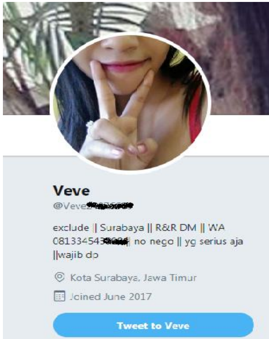
Gambar 3. Profil Pelaku Prostitusi Daring di Twitter

namun ada juga pelaku prostitusi daring yang berani memasang fotonya dengan jelas. Selain foto profil, harga untuk memesan dan persyaratan serta lokasi turut ditampilkan sehingga para pelanggan sudah mengetahui informasi yang dibutuhkan ketika akan melakukan transaksi.