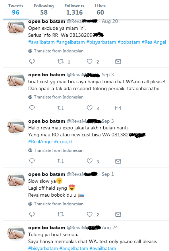
Gambar 5. Komunikasi Level Meso di Twitter

Jika dulu para pelaku prostitusi “mangkal” di pinggir jalan, lokalisasi, pub , atau dapat dipesan melalui germo , sekarang dengan adanya media sosial seperti Twitter memudahkan mereka dalam melakukan promosi dan menggaet pelanggan. Dengan menggunakan media sosial maka aktivitas prostitusi menjadi semakin luas dan kompleks karena tidak terbatas oleh ruang dan waktu. Media sosial digunakan sebagai media untuk melakukan pemasaran sendiri dan tidak tergantung dengan mucikari sehingga memotong rantai bisnis prostitusi dan mengurangi fee untuk mucikari.