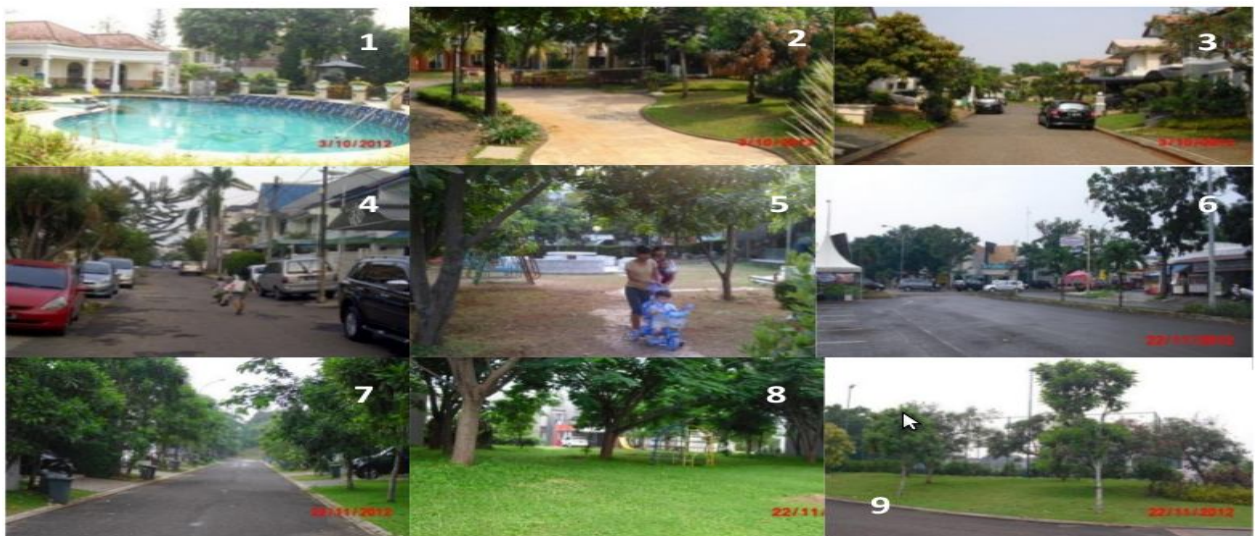
Gambar 1. Foto lingkungan rumah Club house rumah Dimas (1 & 2), jalan depan rumah Dimas (3), Jalan depan rumah Dewi (4), taman lingkungan rumah Dewi (5), jalan depan rumah Martin (6), jalan depan rumah Evan (7), taman bermain & lapangan lingkungan rumah Evan (8 & 9)

ada relasi sosial yang baik. Budaya bermain saat ini adalah bermain dengan jumlah anak yang lebih sedikit, lebih banyak aktivitas yang terorganisir, lebih banyak kegiatan sekolah dan akademik, lebih jarang kontak dengan anak-anak yang berbeda usia, anak-anak cenderung berkumpul dengan anak seusianya, orientasi bermain menjadi di dalam ruangan, teman bermain menjadi lebih jauh.