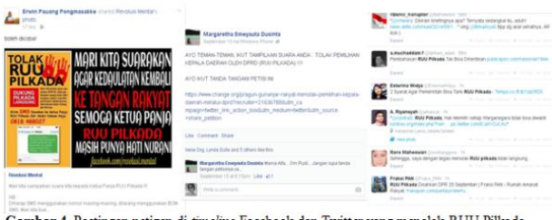
Gambar 4. Kiriman netizen di timeline Facebook dan Twitter yang menolak RUU Pilkada (terjadi partisipasi dalam pengambilan keputusan politik oleh warga)

Media sosial seperti Facebook dan Twitter ikut menjadi media netizen dalam memberikan partisipasi politiknya dalam polemik RUU Pilkada. Ini terlihat dalam sejumlah kiriman ( posting-an ) netizen yang diambil secara acak melalui Facebook dan Twitter yang sebagian besar menolak disahkannya RUU Pilkada menjadi undang-undang.