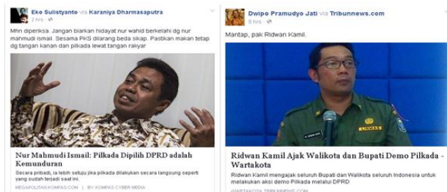
Gambar 1. Kiriman netizen di timeline Facebook yang menolak RUU Pilkada ( Share berita dari media online lainnya)

“Mhn diperiksa Jangan biarkan hidayat nur wahid berkelahi dg nur mahmudi ismail. Sesama PKS dilarang beda sikap. Pastikan makan tetap dan tangan kanan dan pilkada lewat tangan rakyat.”