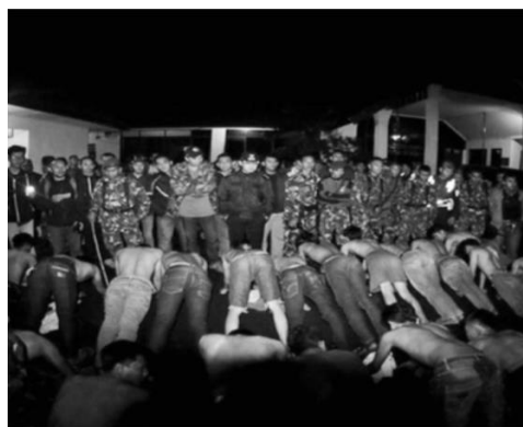
Gambar 3. Operasi Geng Motor oleh Pemkot Bogor

“Kalo soal penataan kota ada, tapi nggak semua, misalkan soal perda ketertiban umum gitu kan, kayak misalkan waktu itu ada orang yang corat-coret di underpass itu kita foto terus kita sebutin tindakan gak bertanggung jawab, melanggar perda dan lain-lain, jadi itu ada tapi gak seluruh sih, gak seluruh regulasi kita masukin, yang berkaitan aja” (Informan 2, Bogor, 24 Februari 2017).