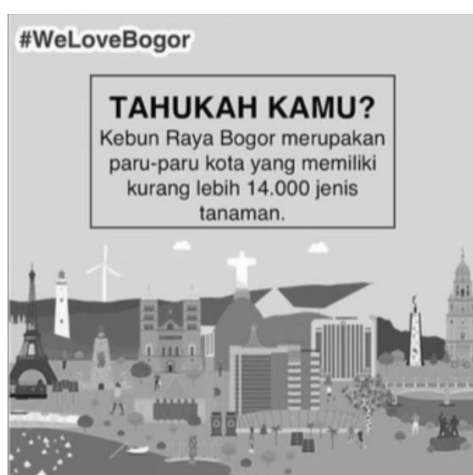
Gambar 2. Atribut Materiality Kota Bogor di Instagram