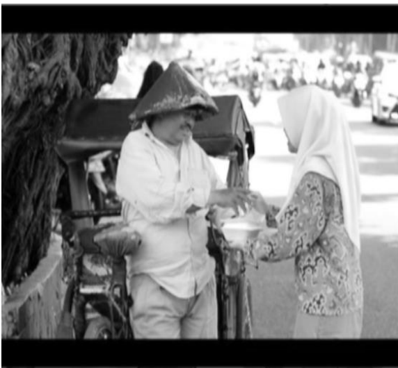
Gambar 4. Siswa SMA di Bogor Membagikan Sembako untuk Masyarakat

“Saya melihat, hmm sudah ada hal yang modal positif ketika warga Bogor itu care terhadap kotanya. Pun masalahnya selama ini hmm warga Bogor itu, tidak punya ruang untuk menyalurkan. Sehingga hanya mengkritik di belakang. Nah, sekarang saya ingin membangun satu ruang di mana warga itu, bisa berkontribusi. Jadi bukan hanya sekedar nyinyir, tapi beraksi untuk menjadi bagian dari solusi” (Informan 7, Bogor, 24 Februari 2017).