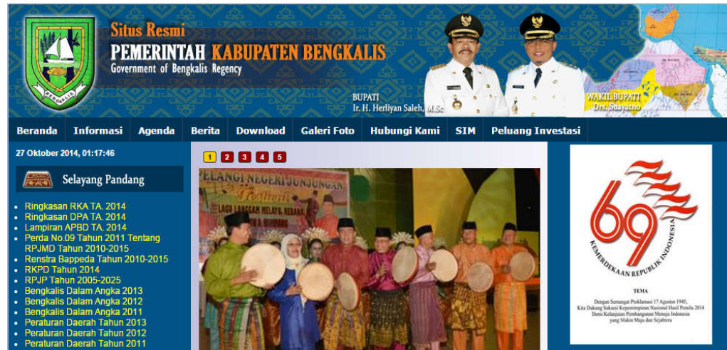
Gambar 1. Halaman website Pemerintah Kabupaten Bengkalis

Website kedua yang menjadi sampel penelitian adalah website Website Humas Pemerintah Kabupaten Bengkalis yang dikelola oleh Bagian Humas yang berada di bawah Sekretariat Daerah Pemkab Bengkalis. Website ini dapat diakses melalui alamat humas.bengkaliskab.go.id . Berita-berita mengenai kegiatan resmi Bupati, Wakil Bupati, atau Sekretaris Daerah adalah fokus dari informasi pada website Humas. Berita-berita tersebut ditulis dan dikirim langsung oleh staf Bagian Humas Pemkab Bengkalis yang secara khusus ditugaskan sebagai peliput berita pada saat kegiatan berlangsung. Kepala Seksi Peliputan Bagian Humas dalam wawancara menjelaskan, selain ditampilkan di website Humas, berita-berita tersebut juga dimuat pada beberapa surat kabar harian lokal di Kabupaten Bengkalis. Dengan begitu, masyarakat luas dapat mengetahui kegiatan para pemimpin daerahnya serta event-event yang ada di daerahnya. Tampilan halaman depan website Humas ditunjukkan seperti pada gambar 2.