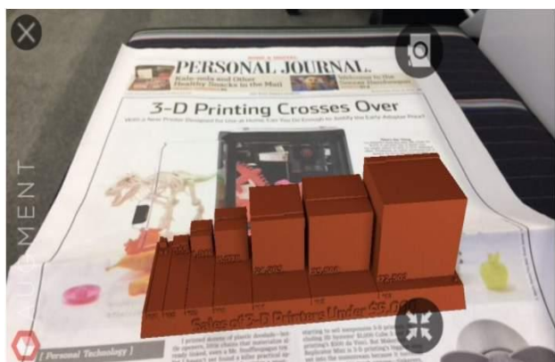
Gambar 1 AR pada Infografis

Frohlic (2017) melihat ada dua pertimbangan mengapa media cetak dapat menggunakan AR, yaitu berkaitan dengan layout yang menjadi karakteristik media cetak serta untuk mengikuti perkembangan iklan digital yang harus diikuti juga oleh media cetak. Penggunaan AR dalam media cetak dapat dilihat dari dua sisi, yaitu: Pertama yaitu usaha memadukan inovasi untuk menarik minat pembaca karena AR mampu menghadirkan citra lain ketika sedang membaca. Penerapan pada koran cetak dapat dilihat sebagai usaha mempertahankan platform cetak dalam dunia media.