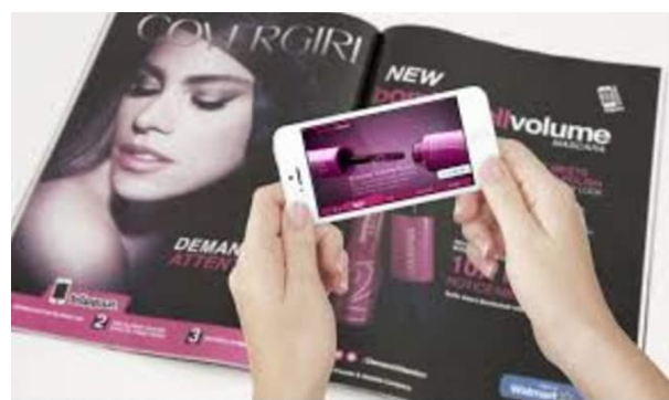
Gambar 2 Iklan AR dalam Media Cetak

Kedua yaitu meraih pangsa periklanan yang lebih luas. Trend AR dalam dunia periklanan menunjukkan peningkatan yang signifikan. AR akan menambah persepsi pengalaman konsumen ketika berbelanja serta kustomisasi ketersediaan produk (Pantano, 2017). Kelompok usia konsumen yang menerima AR dengan cepat adalah para anak muda. Dalam konteks pemasaran, pasar anak muda sangat strategis karena mereka mudah sekali beradaptasi dengan teknologi, akan menjadi konsumen dalam jangka waktu yang panjang, serta lebih terbuka akan perubahan trend yang diciptakan produsen. Untuk itu, media cetak seharusnya sudah menyediakan AR dalam iklan yang ada dalam dunia cetak. Tanpa mengikuti trend AR, pasar periklanan media cetak akan semakin meredup karena tidak bisa menyaingi iklan dalam dunia online .