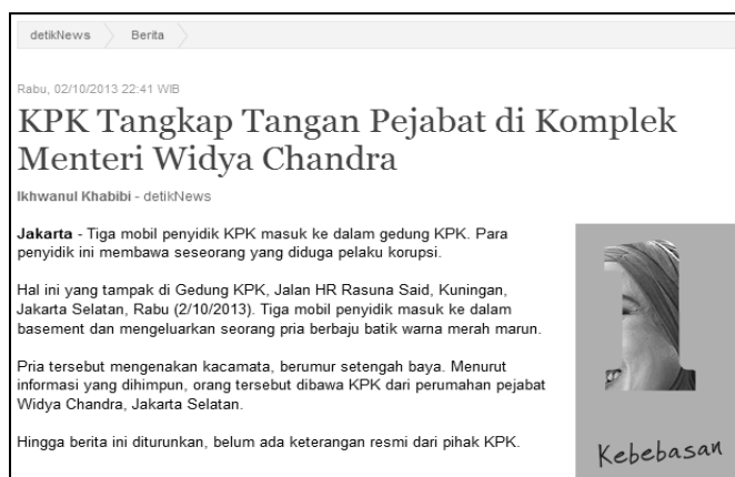
Gambar 2 Berita detikNews dengan informasi yang belum lengkap

Mutu suatu tulisan antara lain ditentukan oleh sumber beritanya. Siapa atau apa yang menjadi sumber itu harus jelas sehingga pembaca dapat menilai sendiri. Karena itu menurut Ishwara (2011: 106), nama atau asal sumber ini harus dicantumkan, siapa dia dan apa kemampuan atau keterampilan sumber itu. Pencantuman nama sumber tidak membuktikan bahwa apa yang dikatakannya itu selalu benar. Hal ini dilakukan jurnalis hanya untuk meletakkan tanggung jawab bahwa benar sumber mengatakan demikian. Para jurnalis menurut Ishwara yang sangat memperhatikan kebenaran enggan berhenti sampai pada pencantuman nama sumber saja, tetapi sering terhalang oleh tekanan deadline bila ingin bergerak lebih jauh untuk memverifikasi bahan tulisan itu.