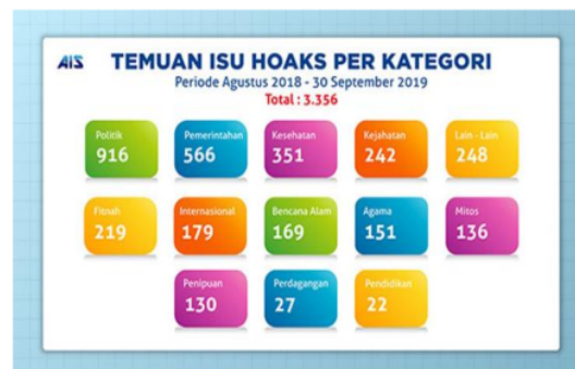
Gambar 1 Kategori Informasi Hoaks

Informasi hoaks dianggap berbahaya karena sering diikuti dengan munculnya hasutan atau hinaan kepada orang lain (hate speech) yang tidak bertanggungjawab. Menurut (Sani, 2019), “data dari Mafindo atau Masyarakat Anti Fitnah Indonesia pada bulan Januari 2019 terdapat 109 informasi hoaks dengan berbagai kategori yang terdiri dari 58 hoaks terkait politik, 7 hoaks terkait kriminalitas dan yang bertema lainnya sebanyak 19 informasi”. Sedangkan data Kemenkominfo menjelaskan selama November 2019 teridentifikasi 260 informasi hoaks dan total ada 3.356 hoaks selama periode Agustus 2018 - September 2019 dengan berbagai kategori (Kemkominfo, 2019). Jumlah informasi hokas per kategori di jelaskan dalam gambar berikut: